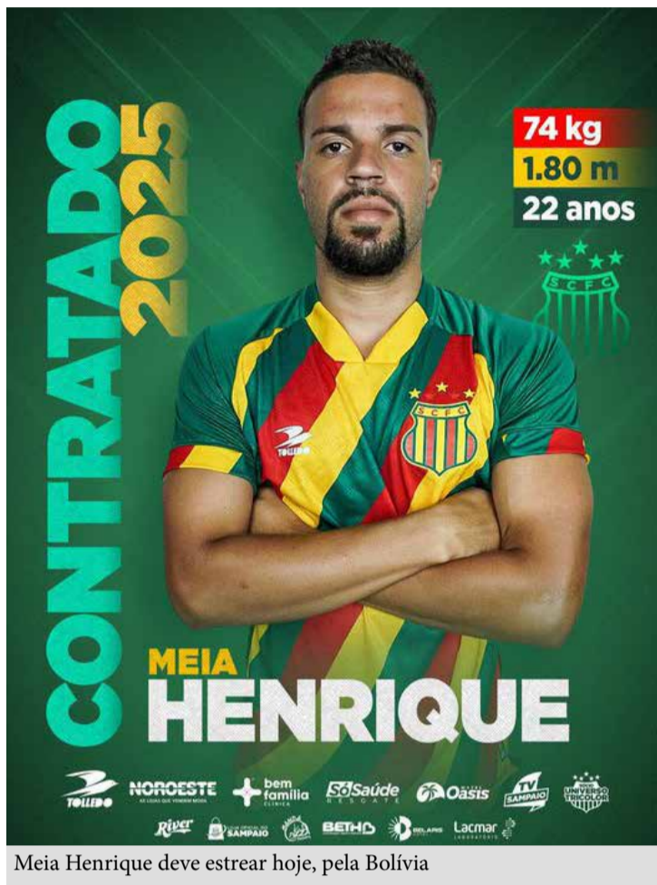
Meia Henrique deve estreiar hoje, pela Bolívia

Sampaio e Imperatriz se enfrentam neste domingo (09), às 16h, no Castelão, pela 8ª rodada do Campeonato Maranhense, a 1ª da fase de volta. A princípio, o duelo seria em Cantanhede, mas o gramado do estádio Biran Castro alagou com a forte chuva de quinta-feira (06), que cancelou MAC x Tuntum (da 3ª rodada) e o Castelão tinha sido vetado por conta também do gramado castigado pela chuva e dos dois jogos no meio de semana pela Copa do Nordeste, mas depois a Sedel acabou liberado. Sampaio e Imperatriz empataram sem gols na 1ª rodada, no Frei Epifânio, mas venceram os jogos seguintes e agora disputam a ponta do Estadual. O Cavalo de Aço é o líder, com 16 pontos e 9 jogos e em segundo, a Bolívia, com 14 pontos, mas com 6 jogos. Pinheiro (3º), com 13 pontos e 9 jogos, Iape (4), com 11 pontos (7 jogos), Maranhão, com 10 pontos (6 jogos) e 7º Tuntum (7º), com 9 pontos (7 jogos) não jogam neste fim de semana, apenas Viana x Moto, em Viana, que pode valer o G4 para o Papão. O Sampaio vai para o seu 3º jogo sob o comando