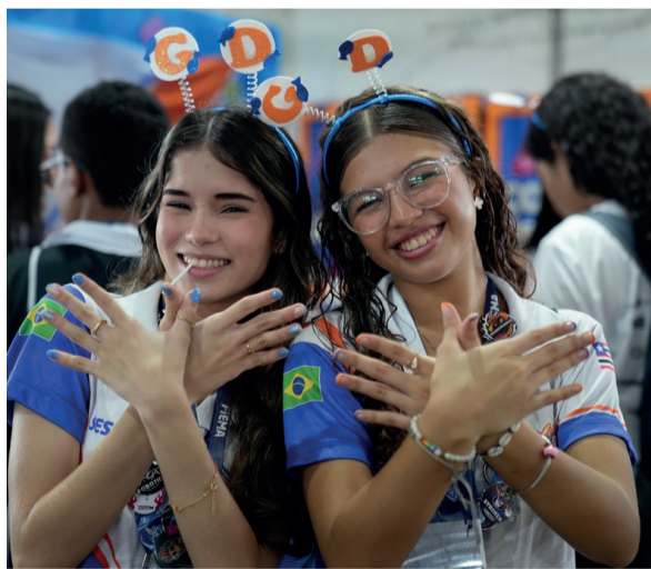
Estudantes maranhenses contribuem para a Década do Oceano, por meio da robótica