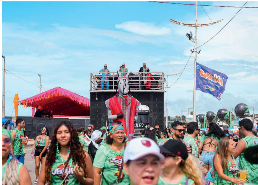
A folia momesca, que trouxe visitantes dos quatro cantos do Brasil e do mundo, entrou para a história pela grandiosidade de atrações e público

Turistas participaram da programação que começava no desembarque do Aeroporto de São Luís