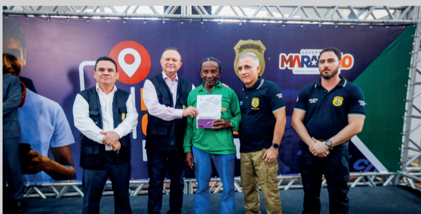
Na primeira etapa, a recuperação estará concentrada em mais de 800 ocorrências de furto, roubo ou perda